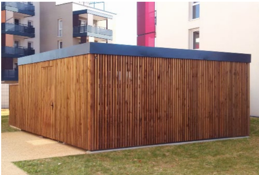
Finition autoclave marron