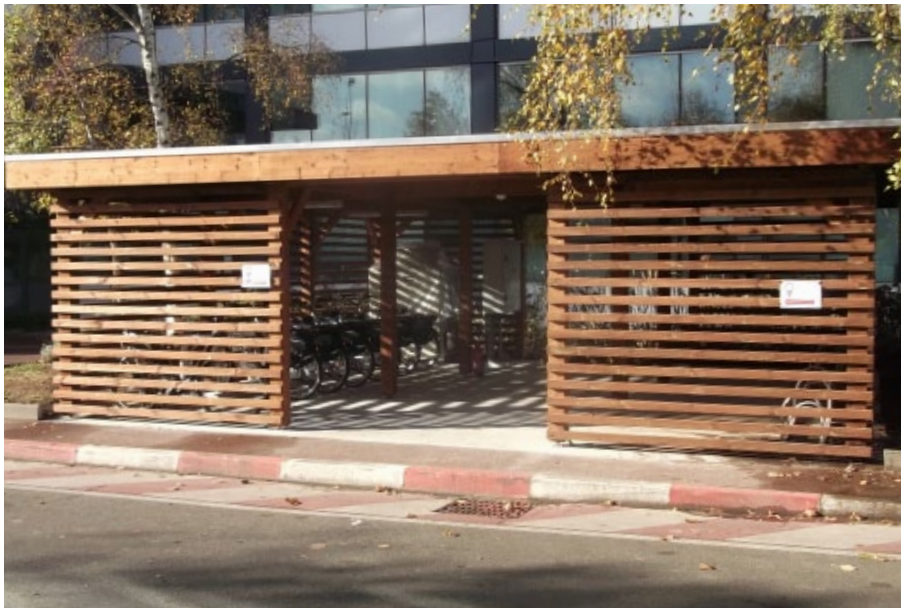
Finition autoclave marron