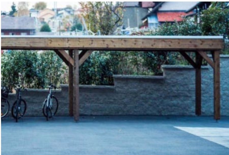
Finition autoclave marron