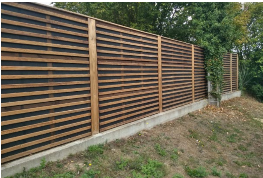
Pose sur platines, sur demande spéciale