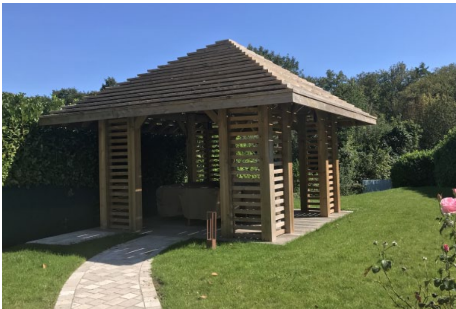
Finition autoclave vert, sur demande spéciale