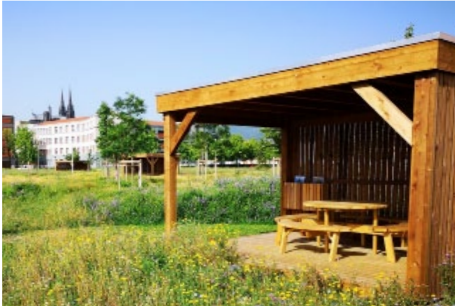
Finition autoclave marron / Plancher sur demande spéciale / Crédit photos : Michelin