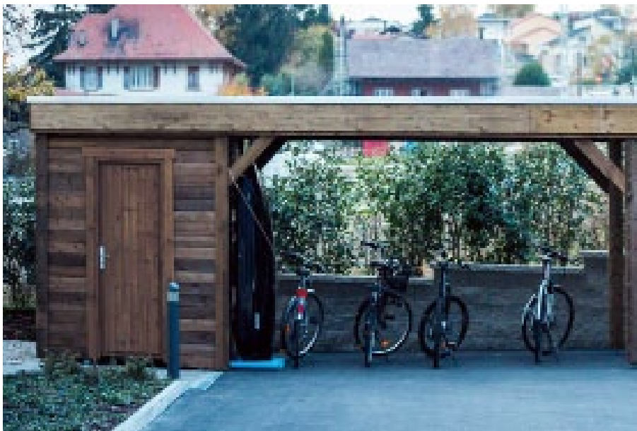
Finition autoclave marron / Dimensions sur mesure et bloc-porte bois