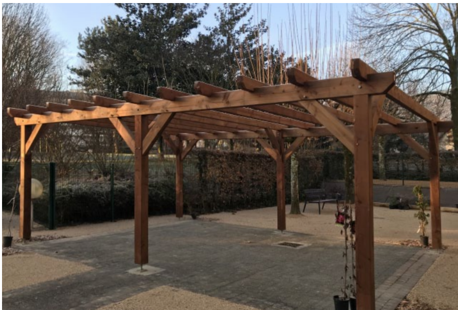
Finition autoclave marron