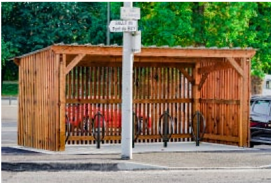
Finition autoclave marron