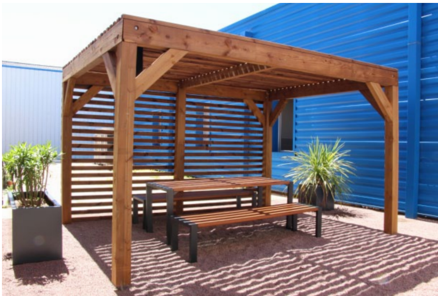
Finition autoclave marron