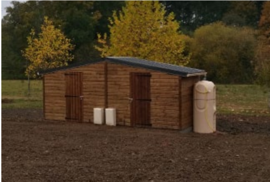
Configuration sur mesure / Options : Habillage des rives aluminium + gouttière et descente PVC / Non compris : récupérateur d'eaux pluviales