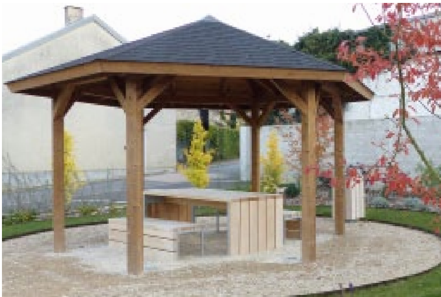
Option : Balustrades / finition autoclave marron et bardeaux bitumeux noir