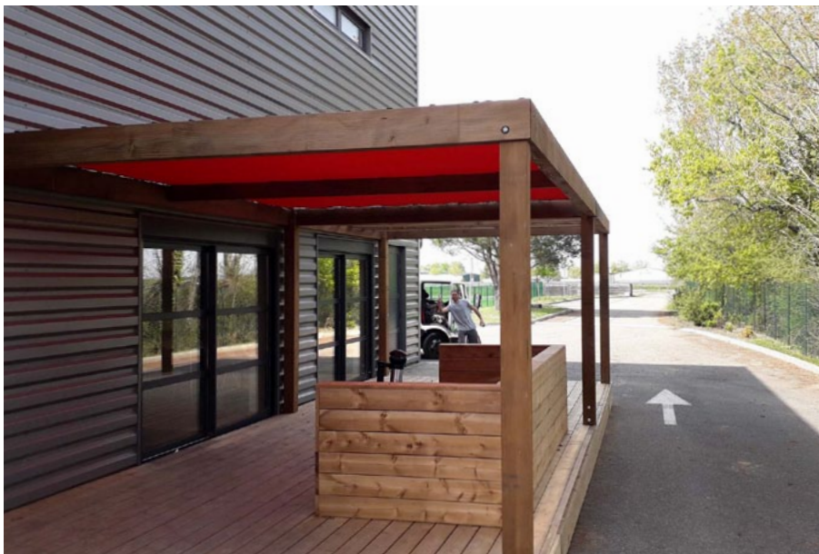
Finition autoclave marron