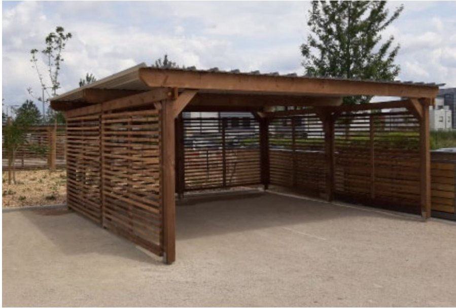
Options : Bardage à claire-voie sur 3 côtés