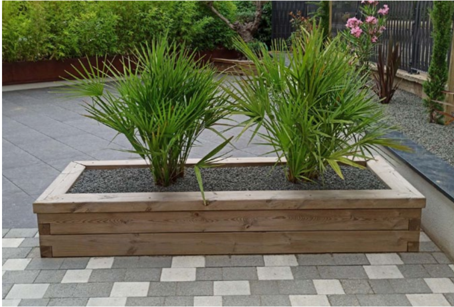
Finition autoclave marron / Configuration sur mesure sans plancher