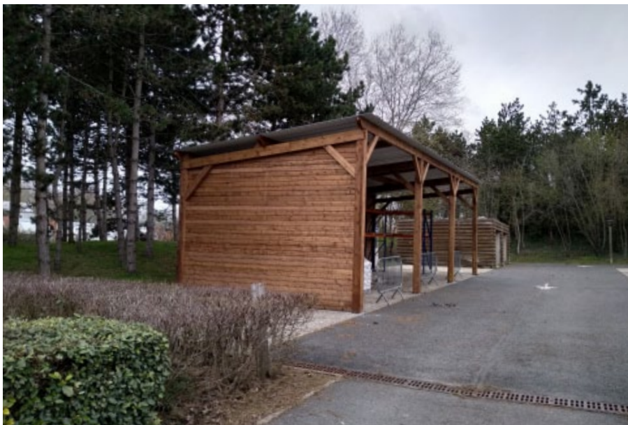
Finition autoclave marron / Fermetures en option