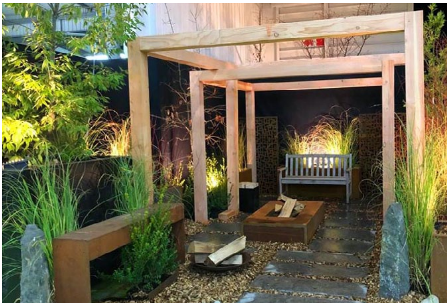
Finition Douglas Naturel